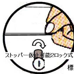
ストッパー仮止可能2ロック式

標準品は扉上部での開閉を行いますので、 標準品に取っ手(ハンドル)は付属しておりません。 又、取手を取り付けるための穴(2ヶ所)も開いておりません。 その為、ご注文の際、ご指定頂いた場合に取手を取付け 発送致しております特注部品(特注仕様)となっております。 尚、サインシールとハンドルを双方取付ける事は出来ません。 但し、サインシールを別の位置に貼られる場合は除外です。